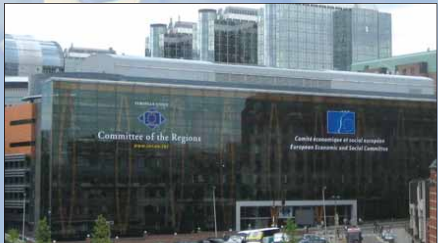
Glavna kancelarija Odbora za regione u Briselu

Traktati obavezuju Komisiju i Savet da se konsultuju sa Odborom za regione kada se predlaže nešto u sferama koje mogu uticati na regionalne ili