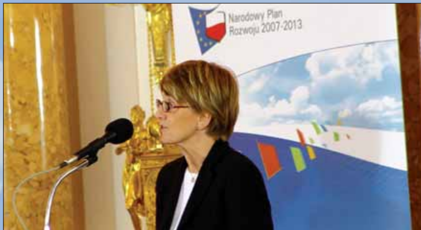
Komisioner regionalne politike EU-a, Danuta Hibner (Danuta Hübner) tokom službenog otvaranja konsultacija nacionalnog plana za razvoj Poljske

2000. do 2006. godine je oko €213 milijardi, ili blizu trećine celokupnog rashoda EU-a. Dodatnih €18 milijardi su određeni fondu za koheziju kako bi se finansirao na infrastrukturi transporta i životne okoline.